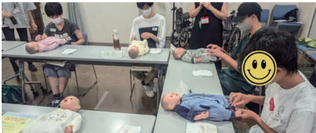
初めての赤ちゃん抱っこ&オムツ交換