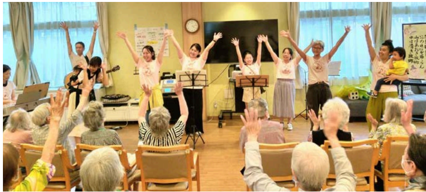
「ママ音楽ユニット♪ショコラッティ♪」さんの演奏風景

高齢者施設での演奏は実に4年ぶりかそれ以上でした。当日は演奏した私たちも皆さんの笑顔にとっても癒され、元気をいただきました。