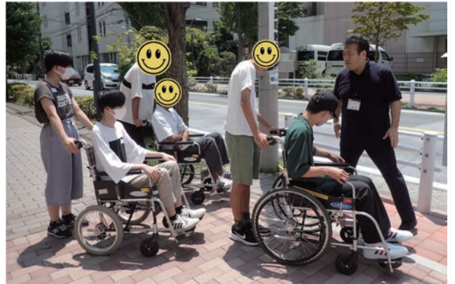
段差が多くて大変だった車イス体験👉

車イスでは2人1組で屋外の段差を体験しましたが「最初は簡単そうに見えたけど、実際は思ったより大変だった」という声があちこちから聞かれました。