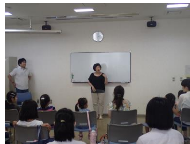
7/29手話体験コースの様子