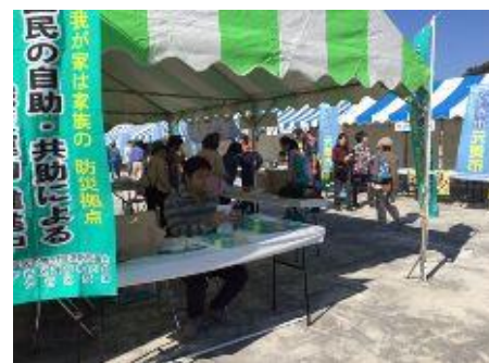
10/15区民まつりの様子