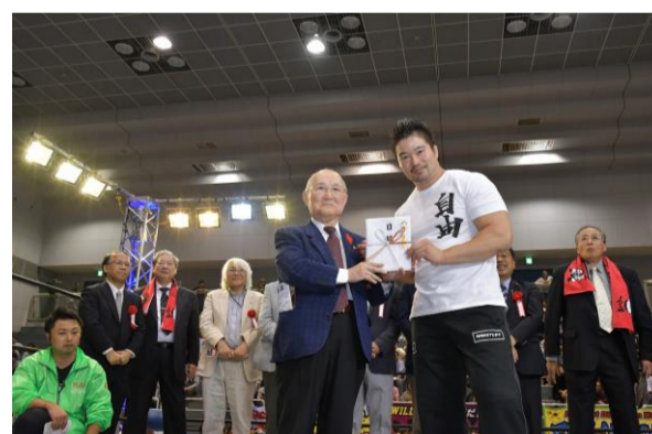
WRESTLE-1 横浜保土ヶ谷大会の様子