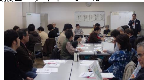
11/2 支えあいの仕組みづくり勉強会の様子