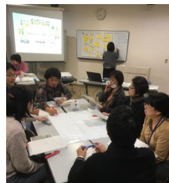
12/14 地域活動交流・ 生活支援コーディネーター 合同連絡会の様子