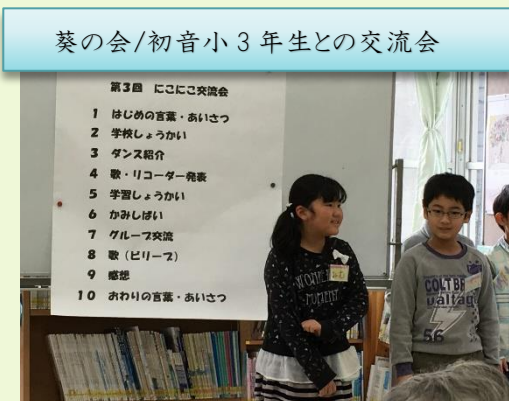
葵の会/初音小3年生との交流会