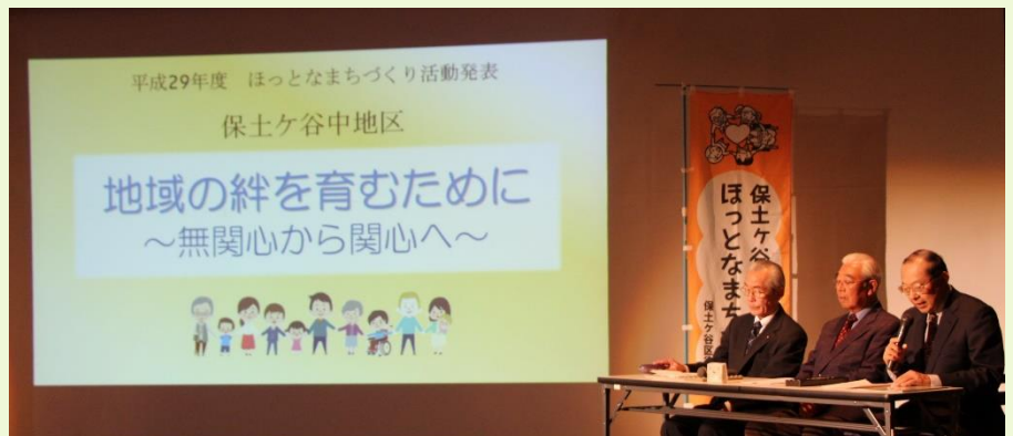
中地区社協代表の左近副会長・内藤副会長・根本事務局長による発表