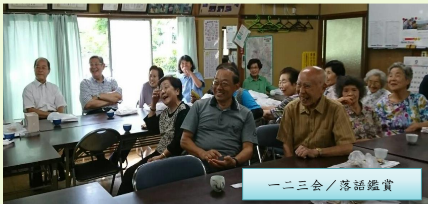
一二三会 / 落語鑑賞