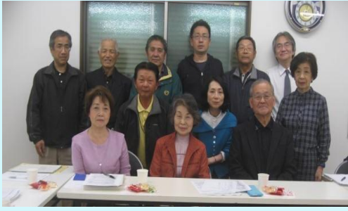
平成 30 年度南部地区連合