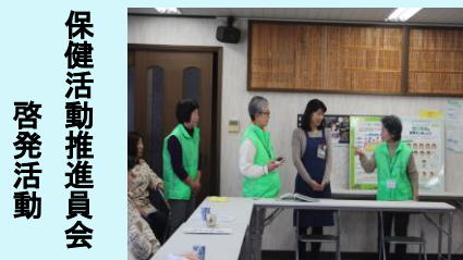
保健活動推進委員会 啓発活動