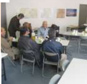
旧東海道松並木講義 ↑ グランドメゾン集会室にて まち歩きティーサロン 「本陣」前集合 ↓