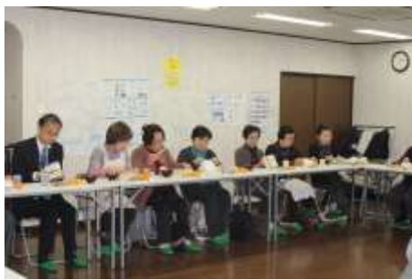
食事会風景 年3回実施 岩井町自治会館にて