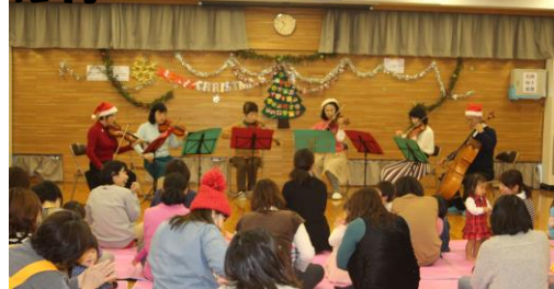
子育て支援ポテト Xmas コンサート