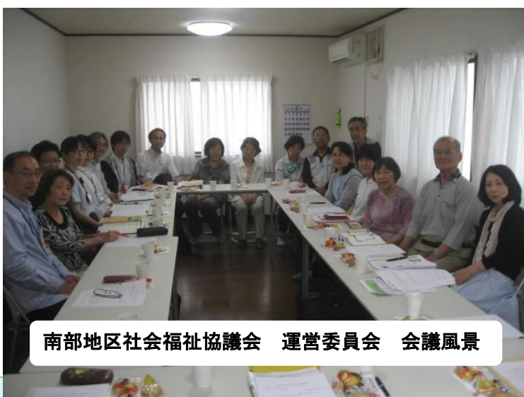
南部地区社会福祉協議会 運営委員会 会議風景

会長になりましたが、書類の書き換え、名義の変更と何もわからない事だらけ。区役所、土木課、何回も行ったり来たりと……なぜか区役所でソフトボール仲間と会う機会があるのです。宮田町の小柴さん、常盤台の橋本さん、上菅田の堤さん、村上さん、西原自治会の飯澤さん。なんと保土ヶ谷区の中で審判仲間が 5 人も 6 人も居られ、お互いのまちの情報交換が出来そうです。自治会役員と協議、協力、相談をしながら総会、夏祭り、餅つき、連合自治会の行事、イベント等々を乗り切っていきます。今後も皆様のご指導ご鞭撻をよろしくお願い申し上げます。