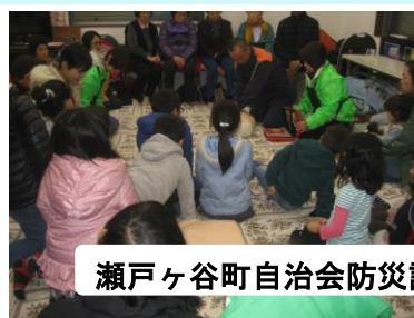
瀬戸ヶ谷町自治会防災訓練：園児、児童も参加