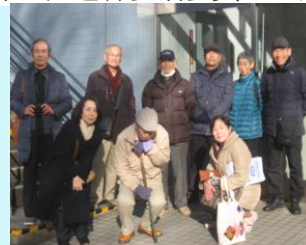
環境事業推進委員会 旭区焼却場見学