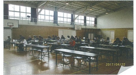
< 4/22 の上菅田地区社協総会の模様 >