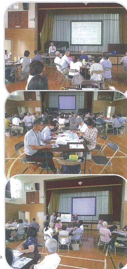
<社協研修会の模様>

研修会を通じて、ボランティアの原点は『社会の人様の役に立つこと』であることを認識して一同散会しました。