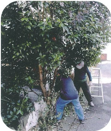
〈垣根の伐採作業の様子〉

日常の自治会の活動を進める原点をこの会員同士の関係ができる様に、自治会活動行事を通じて、日頃の人の交流と信頼関係を構築し、支え合い地域を目的として、この活動を進めております。