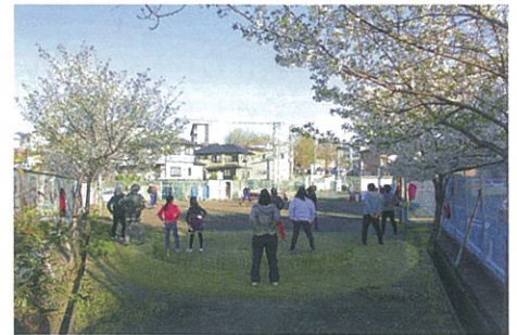
＜ふれあい広場：ラジオ体操＞

シニア世代は毎日の健康維持のために、若い世代は一日の活動の準備として、10分間の朝のラジオ体操は身体の動きにすごい効果があります。各地とも自由参加で実施していますのでお近くの会場でご参加ください。