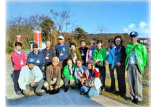
< 日帰りバス旅行 >