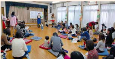
< 区の保健師からのお話の様子 >

保土ヶ谷区が行った「子育てアンケート」から見た現状について、9割以上の方が子育てを楽しんでいると同時に、約2割の方が孤立していると感じていることが分かりました。