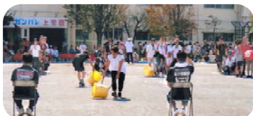
＜ カラオケ競走 ＞