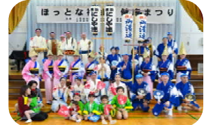
＜ 西谷連・御濱連・阿波踊り ＞