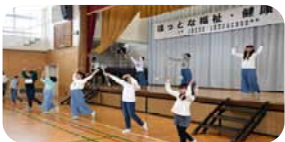
＜ 上菅田小バトンクラブ ＞