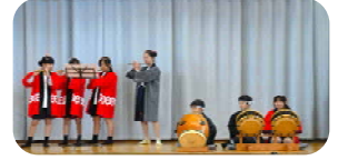
＜ 上菅田おはやし会 ＞