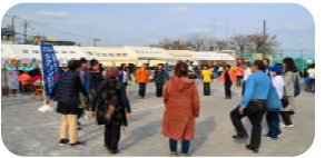
＜ シナプソロジー脳活性化 ＞