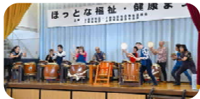
＜ 馬簾太鼓 ＞