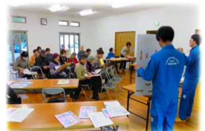
< 昨年の分別講習会の様子 >