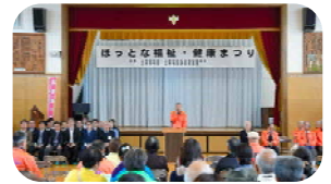
＜ オープニングセレモニー ＞

体育館では、健康志向を目指す地域の体操自主グループや、歌や踊り、地元上菅田おはやし会、馬簾太鼓、街頭紙芝居などが演じられ、フィナーレは「横浜にしや連」と今回初参加の「御濱連」の合同による阿波踊りが、参加者の飛び入りもあり、盛況のもとに行われました。(参加者 約 1,900名)