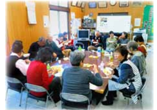
< サロン・カレーライス食事会 >

他に、 震災時の避難訓練 防犯パトロール 安否確認訓練 餅つき大会 広場の一斉清掃 等々の行事が有り、これらを通じて、安心、安全及び福祉健康に繋がればと願っています。