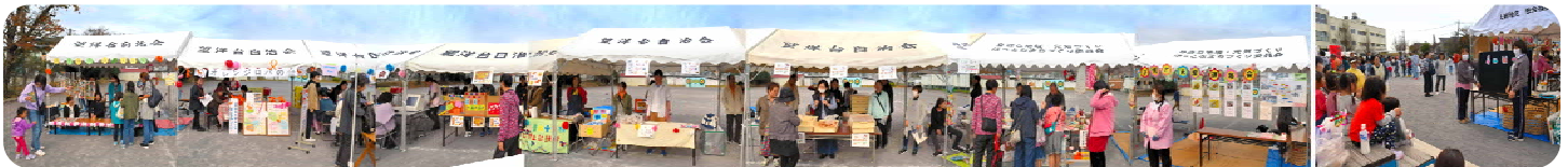
↑ 北側テント「地域の元気力」