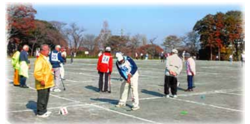
< プレー風景 >

「健康づくり」と「閉じこもり防止」の為に地域のスポーツ活動として グラウンド・ゴルフは最適だと思います。一昨年来、グラウンド・ゴルフを行っていて地区大会、区大会、市大会と勝ち進み、全国大会出場をはたした仲間もいます。どのグループでも参加希望者を歓迎しています。 HP