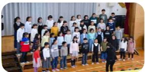
＜ 上菅田小合唱部 ＞