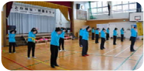
＜ 3B体操クラブ・転倒予防体操 ＞