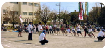
＜ 綱引き ＞