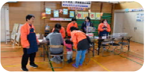
＜ 子育てサロン ＞