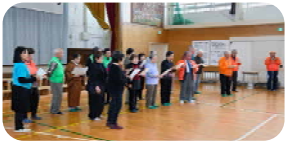
＜ 歌を楽しむ会 ＞