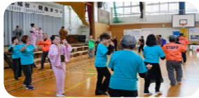
＜ まだまだ元気・すみれの丘 ＞