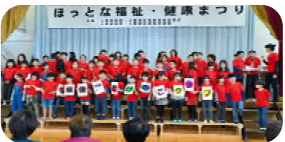
＜ 学童保育たけのこクラブ ＞