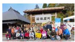
じょうしん健康ウォーキング