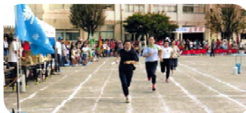
＜ 成人女子リレー ＞