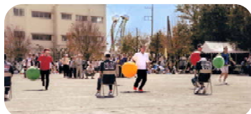
＜ ボール送り ＞