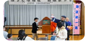
＜ 街頭紙芝居 ＞