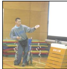
肢体不自由の方のお話