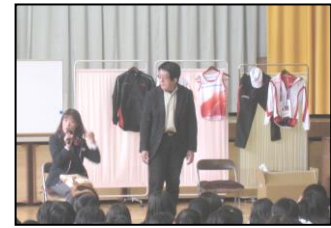
パラリンピック選手のお話