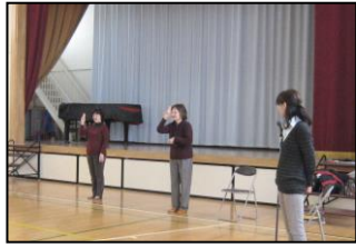
聴覚障がいの方のお話