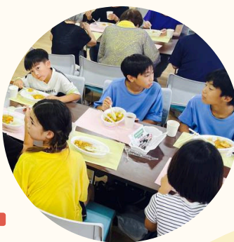
(こども食堂の様子)